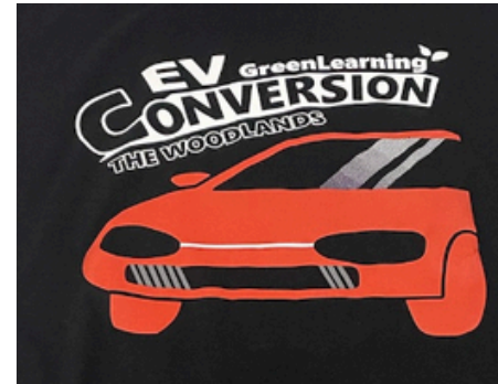
Logo conçu par les élèves de The Woodlands S.S.

L'intérêt et l'enthousiasme des élèves pour les véhicules électriques sont essentiels à la réussite d'un projet de conversion en milieu scolaire. Lors des deux projets ETF, les élèves du lycée Crescent Heights et du collège The Woodlands se sont fortement impliqués dans le projet de conversion et ont même créé un club de véhicules électriques pour y consacrer davantage de temps. Leur enthousiasme ne s'est pas arrêté là : les élèves des deux lycées ont participé à la conception du logo du projet et ont fait réaliser des t-shirts pour le club afin de commémorer leur travail et leur dévouement.